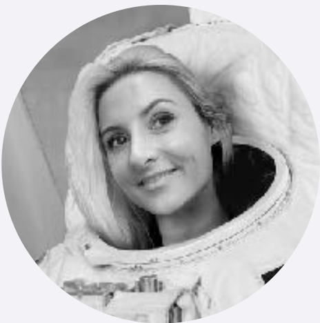
CARO BU R&D