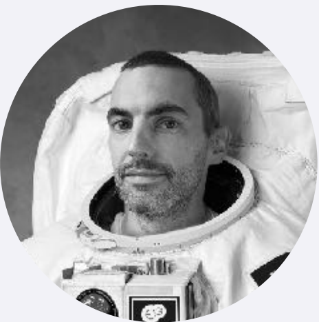
CAZ BU Financement