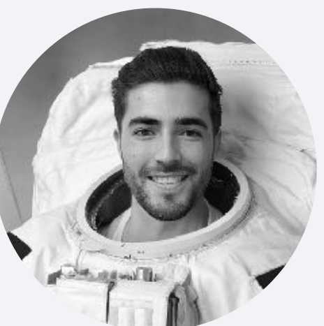
MARCO BU Financement